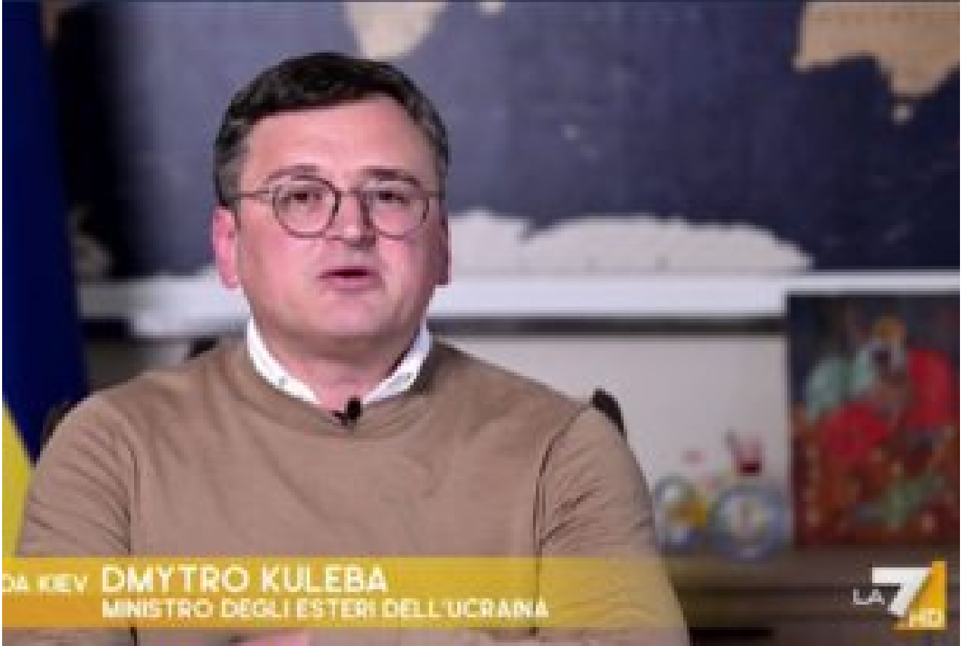
No, Signor Ministro, la guerra non è come una partita di calcio!