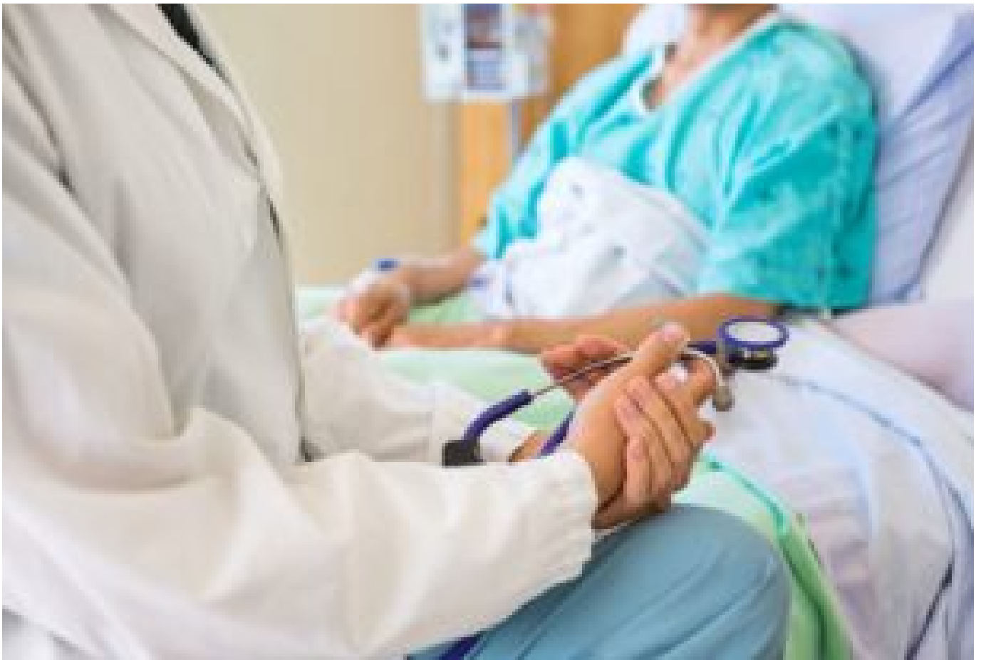
Niguarda, al pronto soccorso arriva una nuova figura "Caring Nurse" per accoglienza